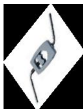
svorka 13- 32