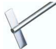
BR 11 – BR 12