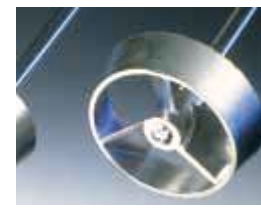
PR31, PR32, PR33