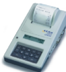
YKT - 01