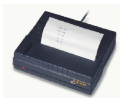
YKB - 01