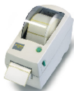
YKL - 01